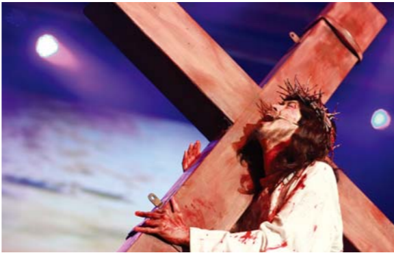
第五幕：十字架的处刑 面对残酷的十字架处刑，耶稣心如刀绞般疼痛，不是因戴上荆棘冠冕，也不是因受鞭打，乃是因为着荒漠之地的众灵魂。