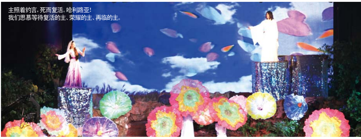
主照着约言，死而复活，哈利路亚！ 我们思慕等待复活的主、荣耀的主、再临的主。

Manmin Central Church website: www.manmin.org Tel: 82-2-818-7060 Fax: 82-2-818-7048 E-mail: manminchina@gmail.com