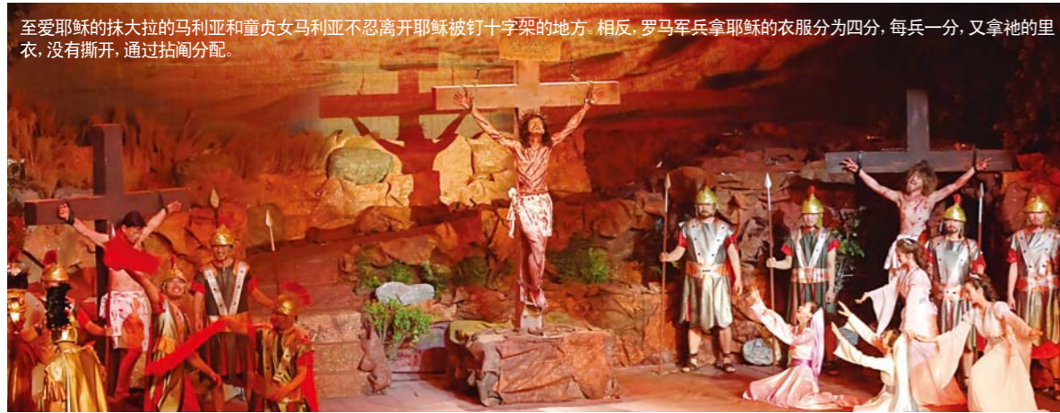
至爱耶稣的抹大拉的马利亚和童贞女马利亚不忍离开耶稣被钉十字架的地方，相反，罗马军兵拿耶稣的衣服分为四分，每兵一分，又拿祂的里衣，没有撕开，通过拈阄分配。