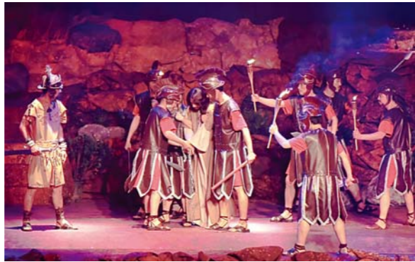
第三幕：耶稣被捕的那天晚上 时候满足，耶稣为了拯救我们脱离罪恶，为自己的离世做好准备，且被军兵捉拿。