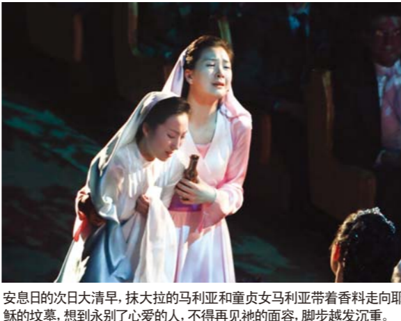
安息日的次日大清早，抹大拉的马利亚和童贞女马利亚带着香料走向耶稣的坟墓，想到永别了心爱的人，不得再见祂的面容，脚步越发沉重。