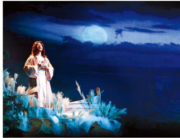
第一幕：加利利海边 耶稣结束一天的圣工，来到加利利海边，思想着天父的旨意，向神祷告。耶稣身边时常有天使相伴。

4月22日，周五彻夜礼拜2部礼拜时，在主堂特设舞台上，上演了复活前夕节目——圣剧“主所走过的路”。由本教会的艺术委员会主创的当天演出，以“宁静的海面”、“等待”、“复活”等神亲自赐下的诗歌组成，动员了合唱诗班和尼西管弦乐团、演员、舞蹈队、剧务等430余名圣徒参演，荣耀了神。