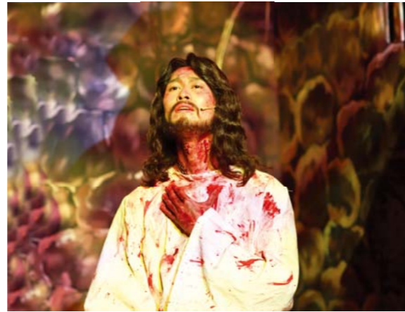
第四幕：被囚的耶稣 耶稣被囚期间依然为众灵魂祷告，身边天使的伴舞仿佛将这向着众灵魂的浓浓的爱传达给天上的父神似的。

在复活节之际，我们一同来缅怀主的足迹，通过画报回顾充满恩典的圣剧——“主所走过的路”。