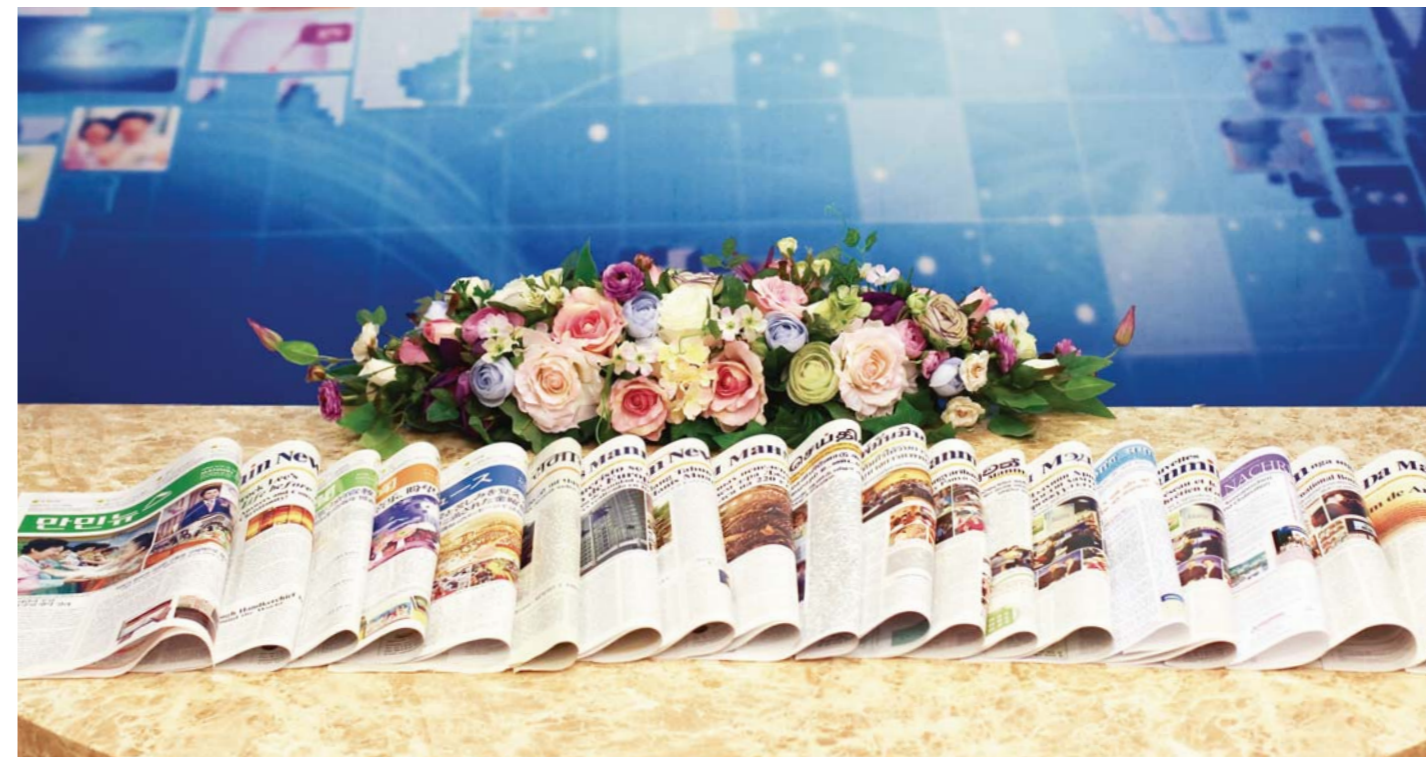
以世界20种文字发行到非洲、欧洲、美洲、亚洲等全世界的宣教新闻——《万民新闻》，正在拯救无数的灵魂归主。