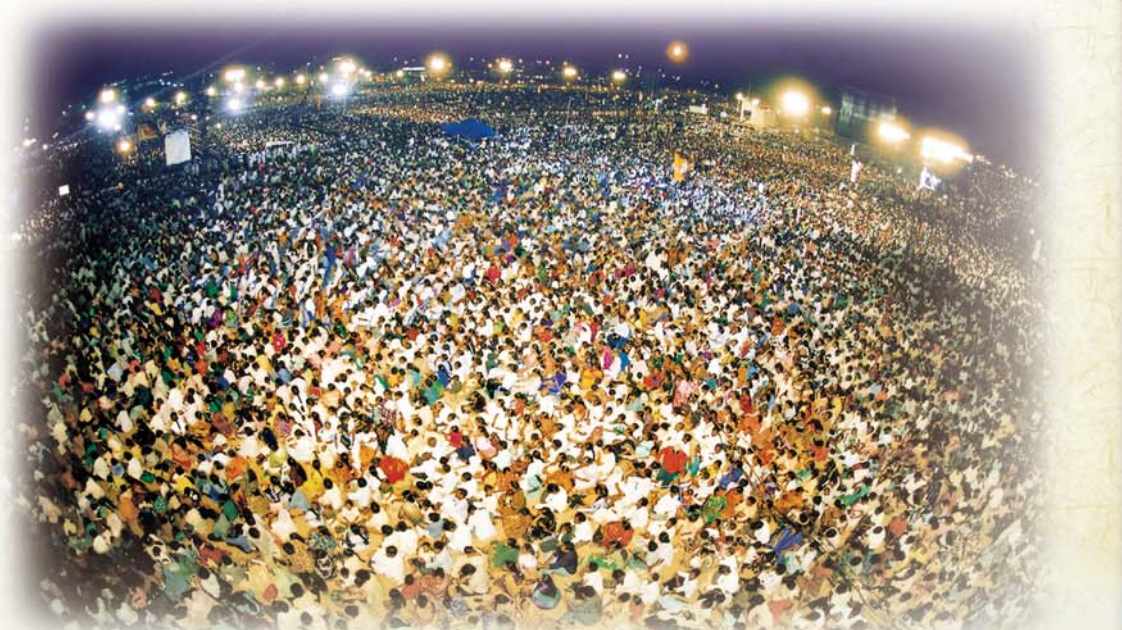
2002年10月，印度泰米尔邦金奈市玛丽娜海滩举行的“特邀李载禄牧师印度联合大盛会”，不受当地政府颁发的“强制禁止改信宗教规定”的压力和影响，有300万人次以上的人参加盛会，并靠创造主神惊人的权能彰显无数医治和改信宗教的神迹，使神的名大得荣耀。

永活的真神按照各人所行的施行报应，故此，按照各人在这地上效法主，以主的心为心的程度，为神国尽忠的程度，在天国的住处和奖赏也必然各不相同。应付的心态过信仰生活，结果勉强得救的圣徒进入的住处是乐园，但自洁成圣，以主的心为心，且又全家尽忠的圣徒则可以进入天国中最美好的住处——新耶路撒冷。万民的众圣徒都带着将来永居新耶路撒冷的盼望，正在火热地奔跑天路。