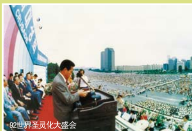
92世界圣灵化大盛会

次日清晨，他发现自己身上的十多种病症已完全消失。通过身上发生的巨大变化，他得知自己经历了奇迹，是神医治了他的疾病，便向神屈膝，高呼：“哦，神啊，您真是活神！”