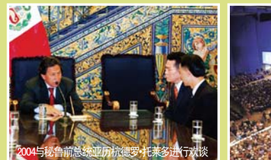
2004与秘鲁前总统亚历德罗·托莱多进行交谈