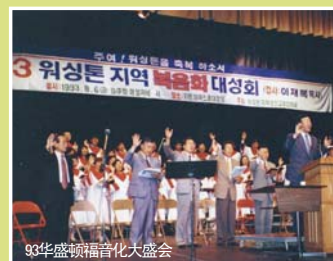
93华盛顿福音化大盛会