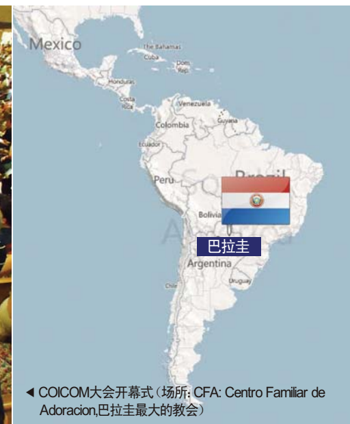
COICOM大会开幕式(场所: CFA: Centro Familiar de Adoracion,巴拉圭最大的教会)

面向全世界170多个国家传扬圣洁福音和神大能的本教会GCN电视台(www.gcnv.org)，参加了南美洲国际基督教传媒庆典——COICOM (Iberoamerican Confederation of Christian Communicators and Mass Media 西班牙语圈基督教广电传媒协会)大会暨博览会。