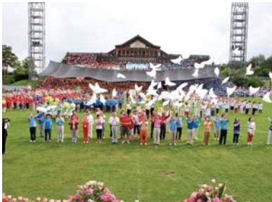
2011年万民夏季修练会(全北茂朱德裕山度假村)