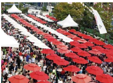
2011年圣诞装饰点灯仪式