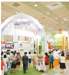
首尔国际图书博览会(三成洞COEX展览中心)

在2011年一年里,权能手帕的功一如既往地彰显。在美国、肯尼亚、刚果(金)、日本、比利时、爱沙尼亚、巴基斯坦、斯里兰卡、泰国、尼泊尔、印度、斐济、以色列等地,有许多人接受权能手帕的祷告后,经历到神的医治和应允,并接待了耶稣基督(使徒行传19章11节-12节)。