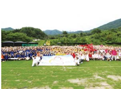
2011年6个联合会夏季修练会(江原道横城星宇度假村)