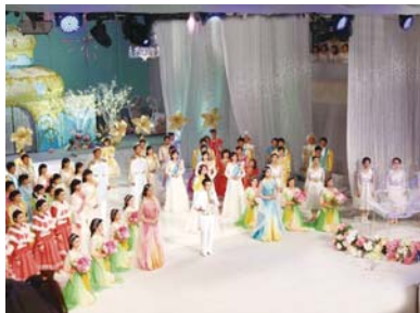
万民中央教会创立29周年庆典