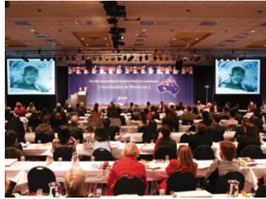
第8届WCDN国际基督徒医生研讨会(澳大利亚布里斯班)