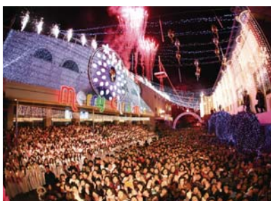
2011年圣诞装饰点灯仪式