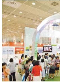
乌陵出版社参加第17届首尔国际图书