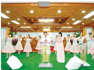
小型恩膏聚会(万民中央教会第二圣殿)