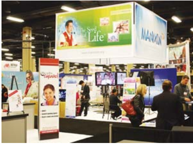
参加第88届NAB(世界基督教广电传媒人士协会)大会暨博览会(美国田纳西州纳什维尔)

在2011年一年里, 神藉着日趋提升的牧者的权能和牧者流泪的恳求, 祝福圣徒们在灵的 激流中得到救恩, 并将许多圣徒引入荣耀神的属灵的境界以及全灵的境界。尤其赐给我们改 变心灵的神元本之光, 充足了人力和财力, 奠定了建造凝聚神荣美之迦南圣殿的基础。