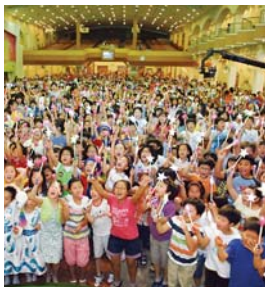
2011年儿童主日学夏季圣经课程