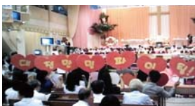
为进入“背诵经文竞赛”决赛的圣徒声援的大田万民教会圣徒们(场所：万民中央教会主堂)

迦南时代即将到来，装备话语凸显为必备条件之一，大田万民教会以身作则，竭力于装备话语，成为顺从的榜样。下面一同来看看大田万民教会是如何做的。