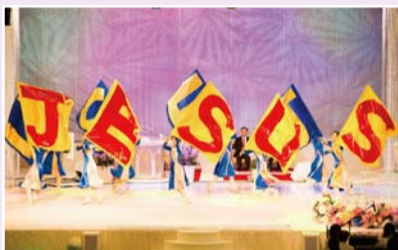
教会创立29周年庆典

国内外聚会及教会各种活动时通过赞美、舞蹈、技能舞、演奏、国乐等表演形式，不仅给本教会圣徒们带来恩典，而且还通过GCN(世界基督徒广电传媒网)电视，给全世界无数灵魂带去感动。介绍其中以丰富多彩的敬拜舞蹈，深受圣徒们喜爱、荣耀神的“能力舞蹈队”。