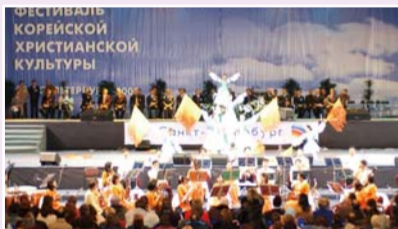
2003俄罗斯联合大盛会