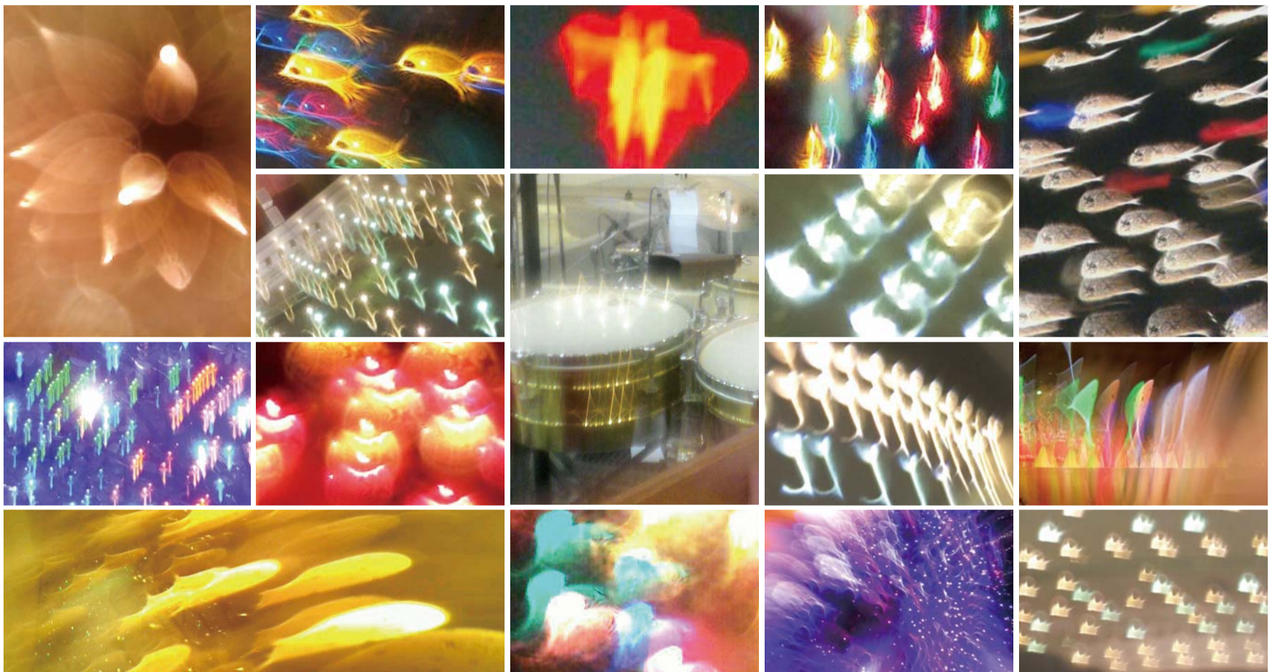
在本教会主堂和院子等场所,当圣徒们用手机拍摄时,呈现形形色色华丽的极光形像。上面的图片就是本教会圣徒们在年末年初拍摄的。置身美妙之光中的各种形像被拍成图片,使圣徒们的信心和天国盼望日渐加增。一般“极光”是在极地地区的高层大气中显现的发光现象。是从太阳中释放出来的带电粒子与极地高空的大气产生离子化而出现的现象,呈现红、蓝、黄、绿、粉等色彩。