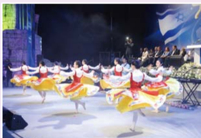
2009以色列联合大盛会