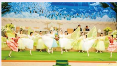
周五彻夜礼拜特别献诗