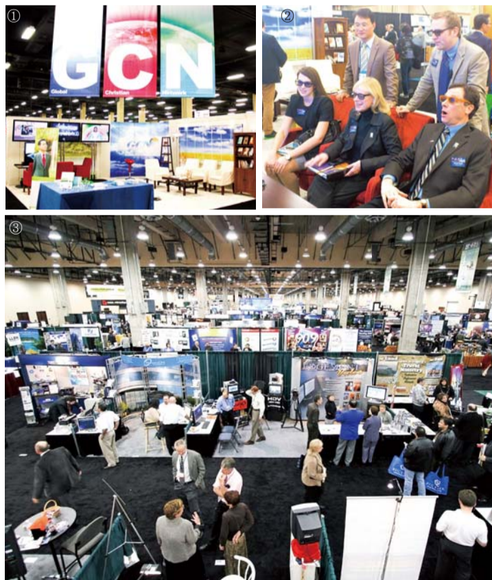
GCN电视台目前将涵盖生命之道和神权能的见证, 以及高水准的基督教文化节目, 播送到全世界170多个国家。在GCN2012NRB大会暨博览会展位(图一); 观看三维立体影像的NRB领导层(图二); 博览会全景(图三)