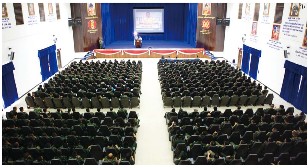
泰国宣教队通过为期12天11宿宣教日程，举行牧会者研习会和手帕聚会，并在皇家陆军师团、青少年教管所等机构场所结合华丽的赞美演出，传播福音，介绍了本教会的权能事工。 图① 3月15日召开的皇家陆军师团聚会 图② 与陆军将领们并排就坐一起观看演出的讲师李圣七牧师（前排左三）和李在元宣教士（左二） 图③ 光之声重唱团的演出

佛教信徒约占总人口95%的佛教之国泰国，现如今通过惊人的圣灵作工，福音兴旺，硕果累累。3月9日至20日，本教会李圣七牧师和艺能委员会所属光之声重唱团圆满结束了泰国宣教之旅。以李圣七牧师为讲师，在泰国北部地区进行了牧会者研习会和手帕聚会、皇家陆军师团聚会、班务别卡、班卡露那青少年教管所聚会。并且光之声重唱团受邀出席了泰国国王84岁大寿纪念活动，敬献公演，荣耀归给了父神。（相关纪实详见第四版面）