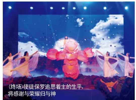
(终场)使徒保罗追思着主的生平，将感谢与荣耀归与神