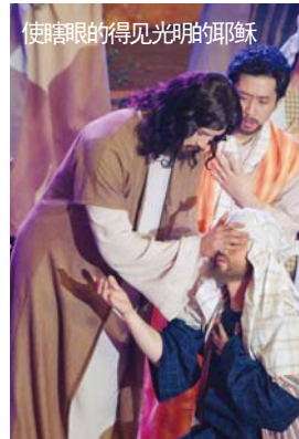
使瞎眼的得见光明的耶稣