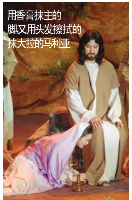
用香膏抹主的脚又用头发擦拭的抹大拉的马利亚