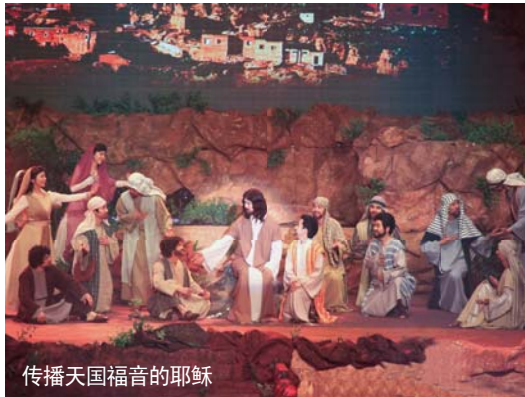
传播天国福音的耶稣