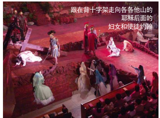
跟在背十字架走向各各他山的耶稣后面的妇女和使徒约翰