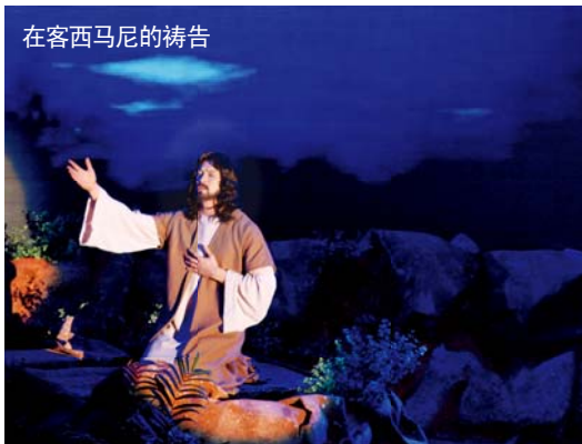
在客西马尼的祷告