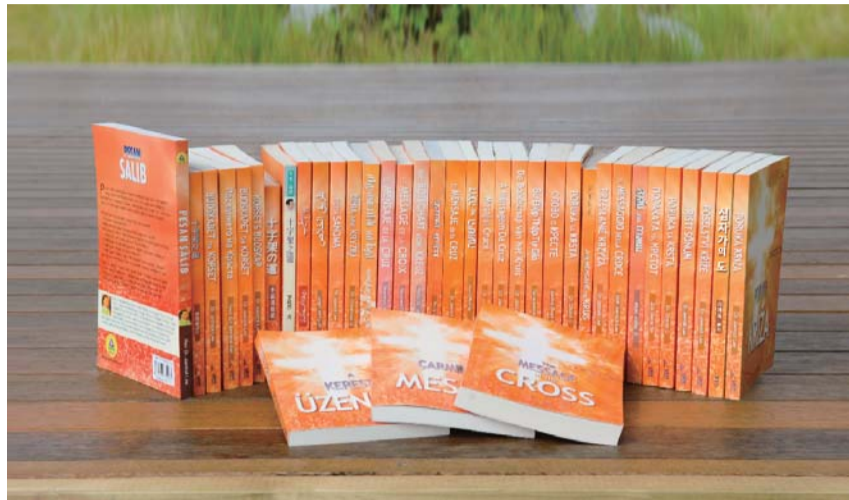
英文、阿拉伯文、希伯来文、印度文等37种文字译本《十字架之道》，正在唤醒全世界无数灵魂。

道》，使“耶稣为何成为我们的救主”、“放置善恶树果的缘由”等基督徒普遍存有的疑结豁然开释，十字架救赎的奥秘揭晓，读之明晰易懂。