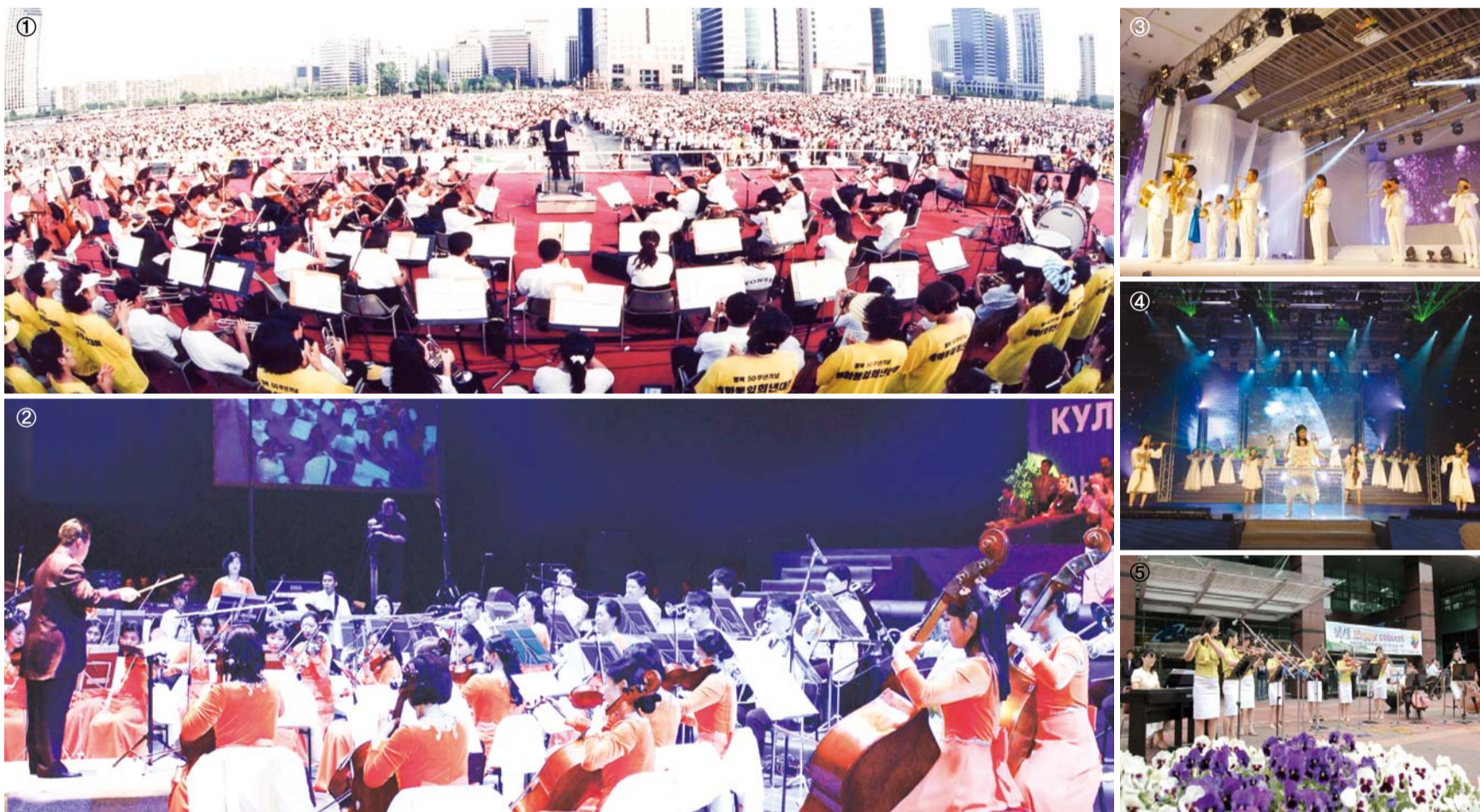
尼西管弦乐团的成员们告白：能够用演奏传扬主的爱和至美天国新耶路撒冷的盼望，是世上最幸福的事。（汝矣岛“光复50周年纪念和平统一喜年大盛会”①；“2003特邀李载禄牧师俄罗斯联合大盛会”②；万民中央教会创立庆典③、④；文化交流活动“尼西快乐音乐会”⑤）

专为神的荣耀而创立的尼西管弦乐团迎来了创团21周年。包括指挥共74名成员组成的尼西管弦乐团是在深知神喜悦赞美的堂会长李载禄牧师经过数年的祷告，于1992年3月1日创团。