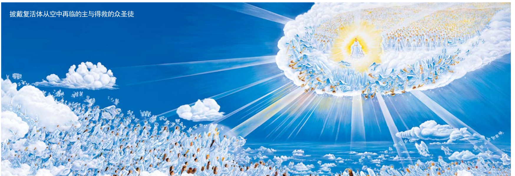
披戴复活体从空中再临的主与得救的众圣徒

对此哥林多前书15章51至53节说：“我如今把一件奥秘的事告诉你们，我们不是都要睡觉，乃是都要改变，就在一霎时，眨眼之间，号筒末次吹响的时候；因号筒要响，死人要复活，成为不朽坏的，我们也要改变。这必朽坏的总要变成不朽坏的（“变成”原文作“穿”。下同），这必死的总要变成不死的。”