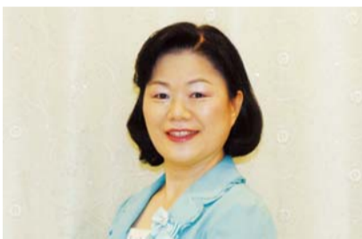
李敏善劝事 (1大大教区5教区)

1985年3月，周五彻夜礼拜结束，凌晨五点回到家里，发现炉中炭火熄灭。当时我过着单身生活，因为一早还要上班，就在炉中点燃蜂窝煤升火，凌晨6时左右躺卧入睡。