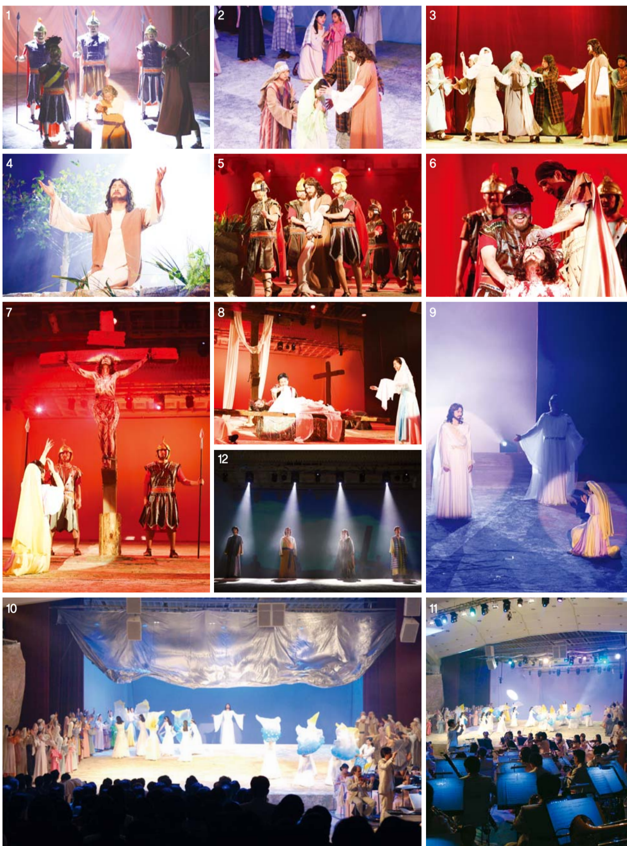
担当救主使命降世的耶稣，传扬天国福音，医治各样疾病和软弱。以十字架大爱打破死亡权柄复活升天（图①即将被斩的使徒保罗；②③使瞎子看见，使已死的拉撒路复活的耶稣；④客西马尼祷告；⑤⑥遭兵丁鞭打；⑦十字架处刑；⑧安葬耶稣尸首的亚利马大约瑟；⑨-⑪主的复活与升天；⑫走主道路的使徒们）。

透过GCN( www.gcnetv.org )一同观看演出的国内外圣徒们，深深感悟主的大爱，立志效法凭靠主的大爱走殉道之路的使徒。借此祝愿大家在这末时，成为与牧者一同向全世界万民传扬圣洁福音和权能圣工的蒙福圣徒。