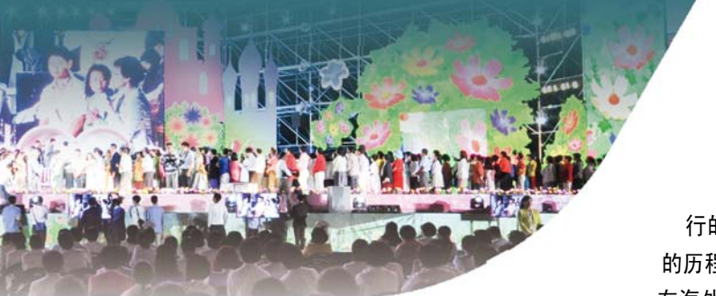
国肢体参加的‘2015万民夏季修炼会。’”