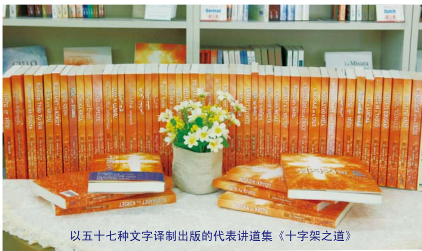
以五十七种文字译制出版的代表讲道集《十字架之道》

例如：有些人不解神为何要放置善恶果，让亚当犯罪堕落。因为他们不知神的旨意就是让人体验相对性，凭自由意志选择善道。也有的人以为神一味的宽容饶恕，即使犯了罪，只要口里认罪，就会施恩赦免；相反也有人认为神是无情的审判者，就惧怕胆寒。这是对神的公义和慈爱了解不够所造成的误解。