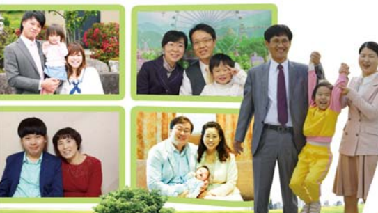
之苦蒙得怀胎祝福的国内外圣徒们。”