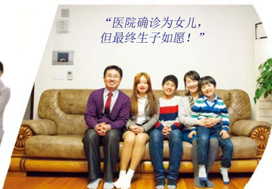
“医院确诊为女儿，但最终生子如愿！”