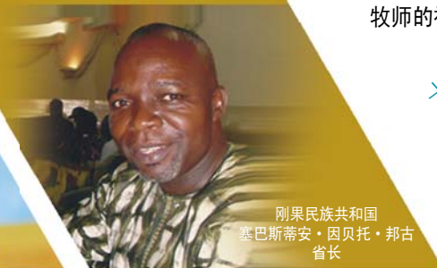
刚果民族共和国塞巴斯蒂安·因贝托·邦古省长