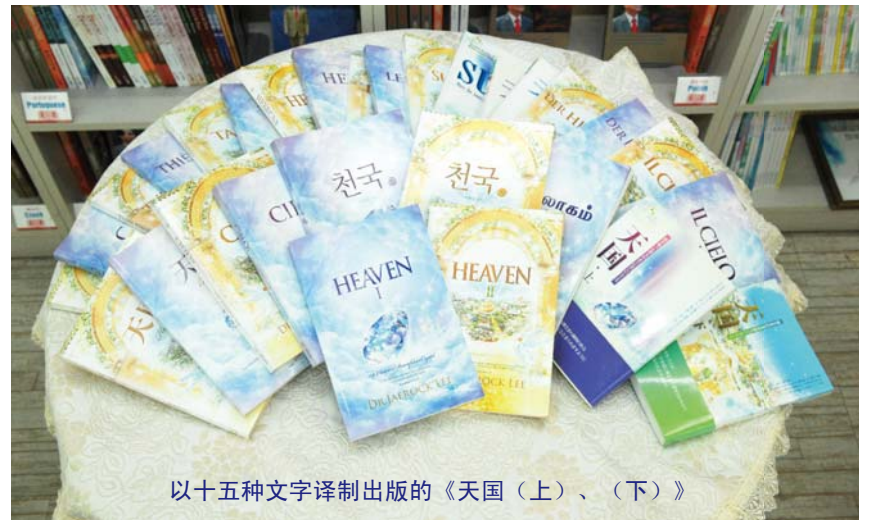
以十五种文字译制出版的《天国（上）、（下）》

使徒保罗因看到第三层天的乐园，就喜乐感恩面对难以言喻的逼迫和苦难，为主、为众灵魂牺牲时间、财物，付出自身所有也不觉辛苦。如今有许多人口口声声说信主，却日日夜夜追求这地上的。但领受圣洁福音的圣徒们因着对天国的鲜活盼望，得以时刻仰望天上的。最为关心的不是地上的荣华富贵，而是力求成圣，忠心侍奉在神家，积累更多奖赏。