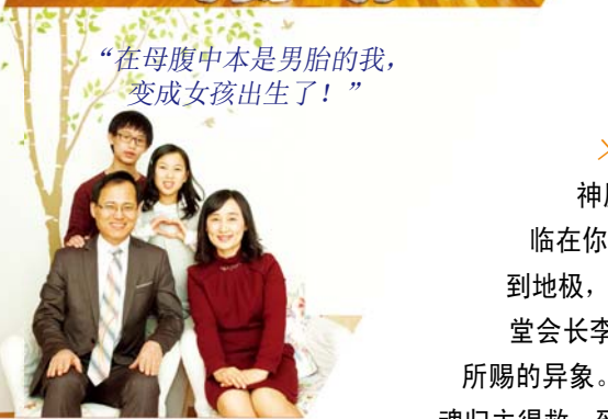
“在母腹中本是男胎的我，变成女孩出生了！”