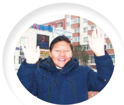
切切索莲圣徒 (59岁，蒙古万民教会)