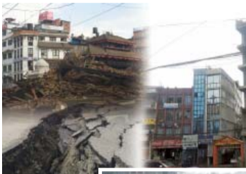
大地震中蒙神保守的尼泊尔万民教会(左右)得到新殿建堂的祝福。