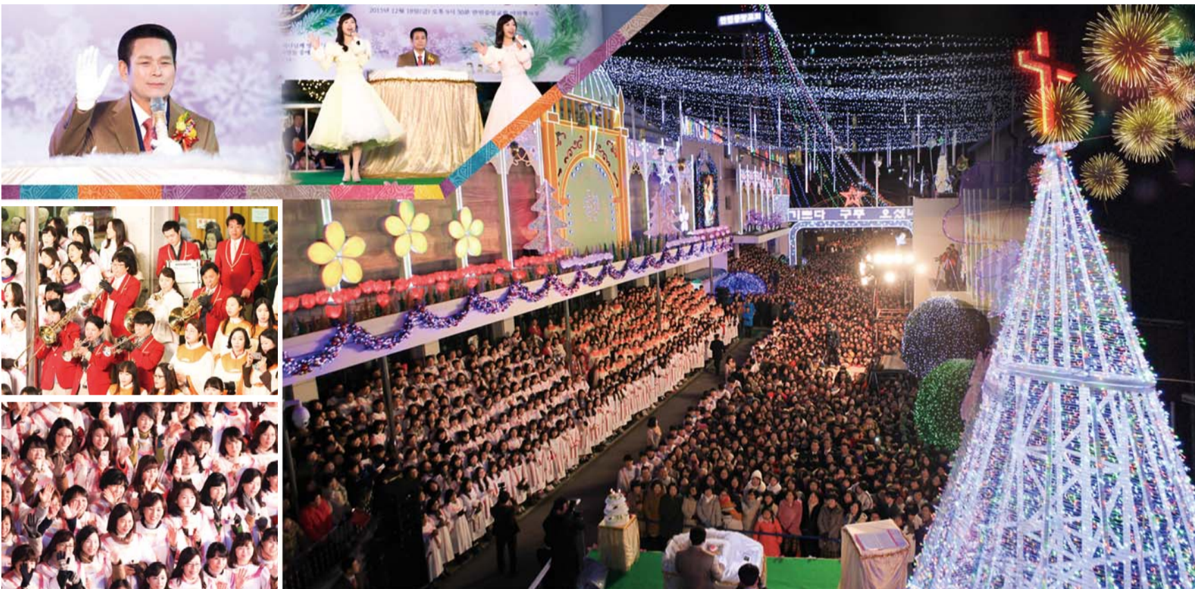
本教会“2015圣诞点灯仪式”于2015年12月18日晚9时50分启动。2015年圣诞装饰是以至美国新耶路撒冷“花之盛筵”为主题装扮。点灯仪式透过GON传媒向全世界直播。

•电话:82-2-818-7060 •FAX:82-2-818-7048 www.manmin.org