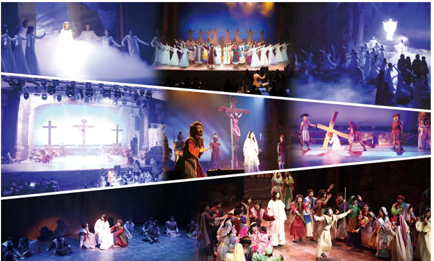
本教会主堂特设舞台上演的圣剧“复活”，使人们再次深深缅怀走十字架之路的主的大爱。均由本教会圣徒们出演，包括舞台音乐、舞蹈、服装、舞台设计等，本教会自筹自办以音乐剧形式现唱演出。

2016 复活节纪念演出“复活”于3月25日周五彻夜二部礼拜，由艺能委员会统筹在本教会特设舞台拉开了帷幕。通过GCN电视(www.gcntv.org)向全世界进行现场直播。以音乐剧形式，现场演唱，仿如耶稣在世圣工和十字架苦难的情景再现，增添了仿佛亲临现场般的感动。共三幕剧演绎的“复活”圣剧，由以马内利唱诗班和尼西管弦乐团、联合赞美组合、哈利