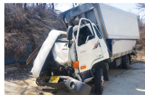
▲ 唯独驾驶座完好无损的奇迹现场车辆

在前车司机的帮助下，我好不容易才下了车。我一时没有回过神来，不知道自己是死是活。“司机没死吧？”直到听见牵引拖车司机的声音，我才意识到：“哦，我还活着。是主任牧师的权能保障了我，保守了我的生命。”