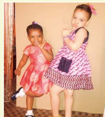
尤查里亚圣徒的弟弟生有两个女儿（下），就盼第三个是儿子。接受祷告后胎儿性别神奇地转为男婴出世（上）。