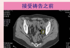
接受祷告之前 左侧尿道见一点三厘米长结石

不动手术很难除掉的一点三厘米长的尿道结石，未经任何医学治疗，只依靠神的权能得蒙医治，将一切感谢与荣耀归与神！