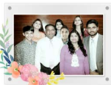
▲ 节目中进行乌尔都语同声传译的梅林姊妹(上)和通过生命之道更新的家人。