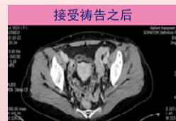
接受祷告之后 左侧尿道原有一点三厘米长结石消失