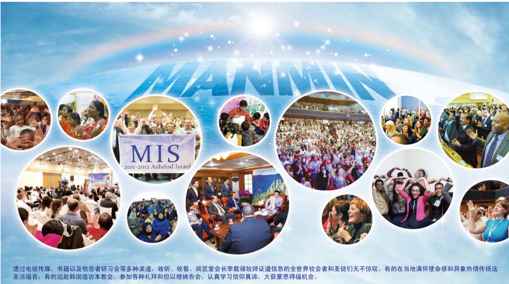
透过电视传媒、书籍以及牧会者研习会等多种渠道，收听、收看、阅览堂会长李载禄牧师证道信息的全世界牧会者和圣徒们无不惊叹。有的在当地满怀使命感和异象热情传扬这圣洁福音；有的远赴韩国造访本教会，参加各种礼拜和但以理祷告会，认真学习信仰真谛，大获蒙恩得福机会。

2016年6月，经由耶稣教非洲联合圣洁会总会长郑明浩牧师传道，得知李载禄牧师的属灵证道和权能事工的刚果民主共和国贝特赛达教团全体加入了本教团，成为支教会。贝特赛达教团是一个下有中、高中、大学、神学院等教育机构齐备的大型教团。总会长嘎布杜·比利阿吉牧师希望通过研讨会及万民国际神学院，持续授教圣洁福音。