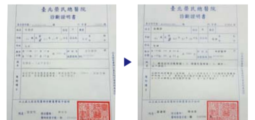
诊断为不治之症老年性痴呆(左)，接受祷告后的CDR分数1分，不见痴呆症状(右)。

尤其是在9月20日，经医院检查确认完全恢复正常。将所有感谢与荣耀都归给让我们体验奇妙权能的三一真神！同时感谢为我们祷告的堂会长！