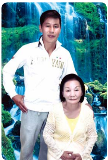
▲ 秀仁切切格圣徒与儿子合影

活在如此前途难以预测、发展不可确定的时代，因置身于神所允许的牧者空间内，每时每刻都有灵肉间亨通的体验。向带领我们步入凡事蒙福之路的三一神敬献所有的感谢和荣耀！