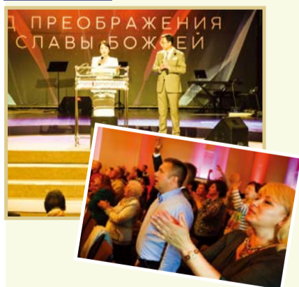
▲ 拉脱维亚里加“新时代教会”聚会

6月13日（周二），在北欧拉脱维亚的“库尔迪加教会”举行聚会（第一版面，图5）。