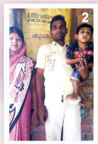
▲ 天生不会走动, 接受祷告后, 能走步的“盎库施”