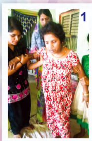
▲ 接受手帕祷告, 左侧偏瘫得愈的“茜玛”

来亲戚家恭贺新婚的人们交流, 婚礼结束后又到各家回访, 传讲创造主神, 阐述为何耶稣基督是我们的救主, 以及怎样才能使罪得赦免。