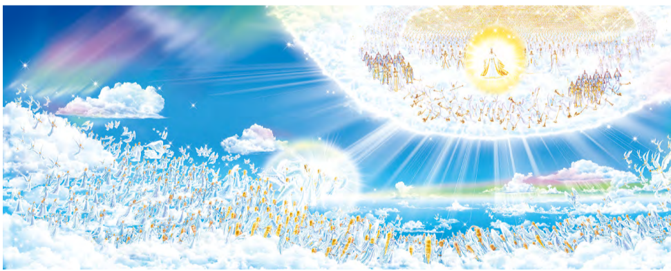
“因为主必亲自从天降临，有呼叫的声音和天使长的声音，又有神的号吹响，那在基督里死了的人必先复活。以后我们这活着还存留的人必和他们一同被提到云里，在空中与主相遇。这样，我们就要和主永远同在。”（帖撒罗尼迦前书4章16、17节）

完成十字架救赎旨意，从死里复活的主被接上升时，天使说：“……你们见他怎样往天上去，他还要怎样来。”（使徒行传1章11节）而且，经上对将来从空中