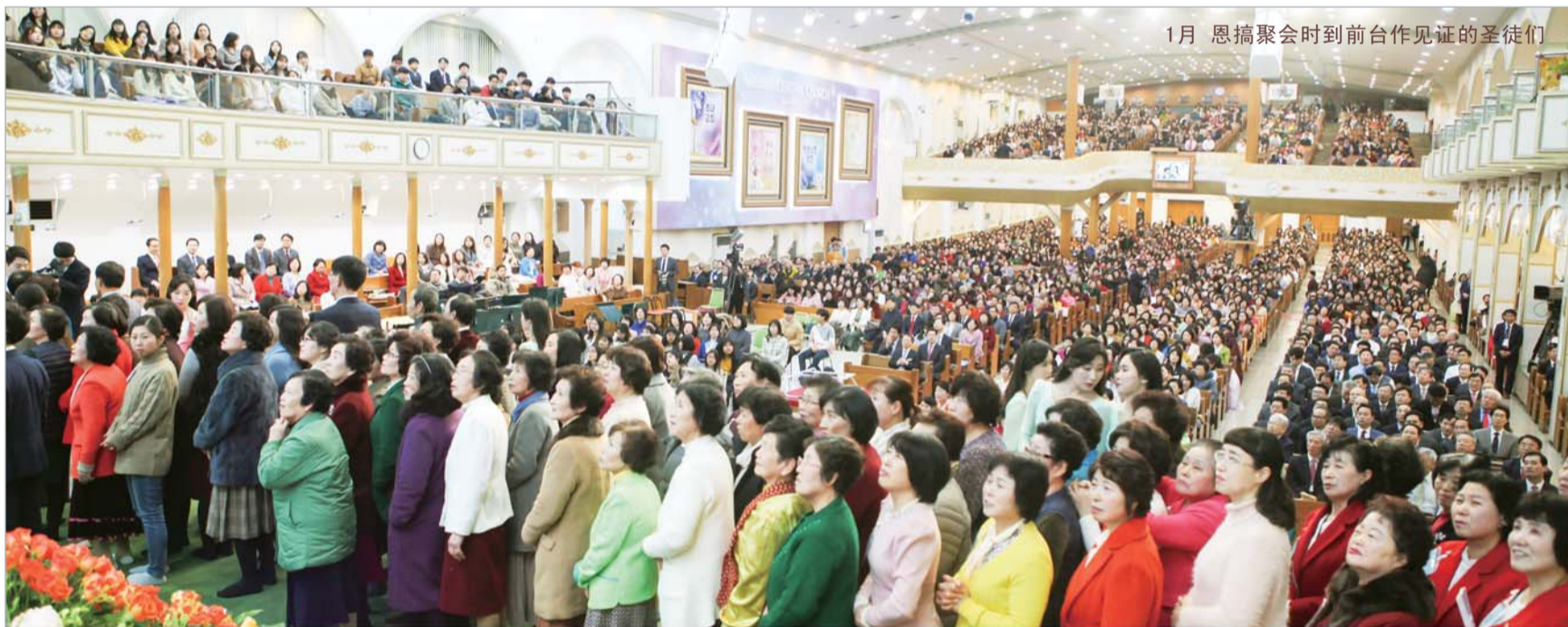
1月 恩膏聚会时到前台作见证的圣徒们

真正爱神的人，自会以心灵和诚实拜神，也爱那看得见的弟兄，神就为他赐福犒赏。奉主圣名祝愿众肢体都能成全不做害羞事的属灵之爱，将无数人领入得救之路，将来在永恒的天国得居如日发光的荣耀之中！