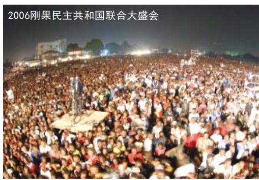
2006刚果民主共和国联合大盛会