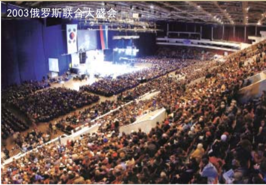
2003俄罗斯联合大盛会

切望所有人都能结出信实忠诚的果子，行事为人完全无可指摘，得神重用，成为神国之栋梁，将来在天上得居神宝座近旁，永远得享极大尊荣！