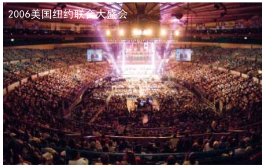
2006美国纽约联合大盛会

牧会者们，表示积极协助以色列盛会。应筹委会主席亚历山大·耶弗牧师之邀出席盛会的牧师，后来为打开以色列宣教之路起到关键作用。