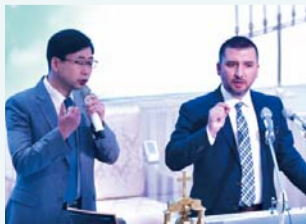
以证道和特颂荣耀神。