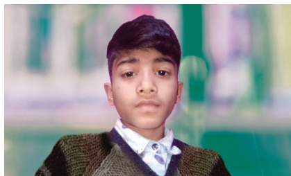
塔克夏穆（印度德里万民教会）