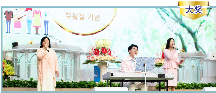
盼望队 (金珍珠传道师一家)