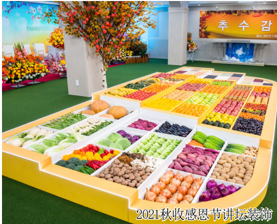
2021秋收感恩节讲坛装饰