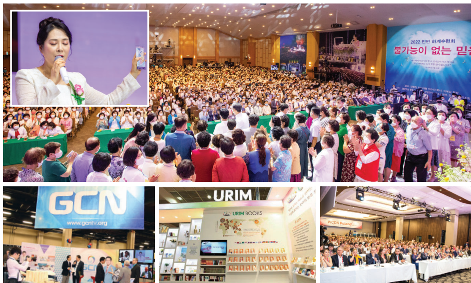
▲凡事都能的信心，“2022万民夏季修炼会”（上）、传播圣洁福音和权能作工的GCN传媒、乌陵出版社、WCDN（下）。