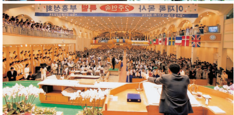
▲92世界圣灵化大盛会(上) 两周连续复兴特会(下)

但也并非一路坦途。也曾经历前景未卜咫尺暗淡的熬炼时期、流泪哀恸祷告祈求之时。但经过那些阶段，最终的结果还是满得祝福。即便是熬炼时期，神同在的确据一刻也没有离开过本祭坛，反而日渐明显。