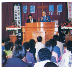
▲1982年10月10日 万民中央教会创立礼拜

万民中央教会自开拓那一刻开始，奇事和神迹不断彰显，教会急速壮大奋兴，世界宣教事工成就卓然。众圣徒蒙允得福，信心逐步进深。