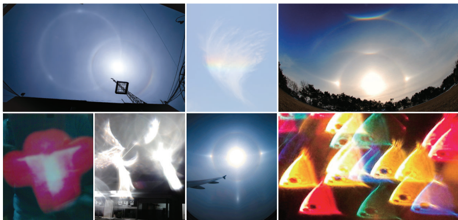
▲三一神同在的确据，助长天国盼望和信心的各种罕见彩虹和多彩绚丽的极光。