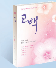
摘自李载禄牧师著作《告白》