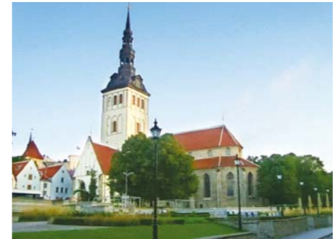
亚历山大涅夫斯基大教堂(俄罗斯东正教会)