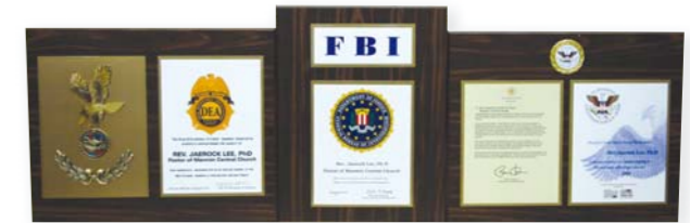
委托牌 感谢牌 志愿服务奖牌

本教会堂会长李载禄牧师荣获了由美国奥巴马总统颁发的“志愿服务奖”。“志愿服务奖”是授予包括在美国国内社会服务活动，以及对社会有贡献的有功之士的奖项。长期以来，李载禄牧师在美国、以色列、印度、巴基斯坦等众多国家彰显了圣经中所记录的：眼睛的看见，瘫痪之人起来行走，癌症和毒品中毒等各种疾病得到医治的惊人的权能作工。这功劳得到认可，通过美国联邦调查局FBI与司法部毒品管制局的推荐，受领了此奖。而且，李载禄牧师受美国司法部毒品管制局下属清除毒品研究院的委任，成为该院国际咨询委员，并从FBI受领了感谢牌。