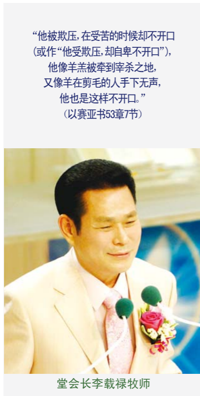
“他被欺压，在受苦的时候却不开口（或作“他受欺压，却自卑不开口”），他像羊羔被牵到宰杀之地，又像羊在剪毛的人手下无声，他也是这样不开口。”（以赛亚书53章7节）

出埃及记12章中出现吃羊羔的方法。除此之外在圣经中还有很多有关“羊羔”的记载。下面列出《圣经》中具有代表性的经文：创世记22章7-8节；出埃及记13章13节、29章38节；民数记