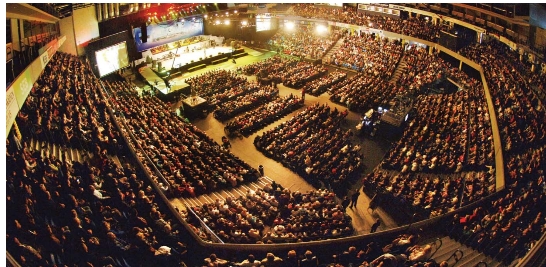
10月30日至31日，著名世界福音布道家李载禄牧师在位于欧洲联盟(EU)成员国之一的爱沙尼亚首都塔林的最大室内竞技场——撒库斯勒哈尔阿列那成功引导了盛会，创下爱沙尼亚基督教史上聚集人数最多的记录，许多人接待耶稣基督，痛得医治，荣耀归于神。盛会实况通过GCM和有线、无线、以及卫星广播，转播到全世界220个国家，引起了爆发性的波及效应。