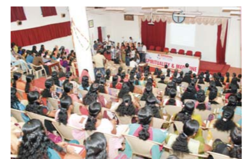
Le Séminaire tenu par WCDN Inde à l'Université Médicale CSI du Mémorial du Dr. Somervell avec 300 participants