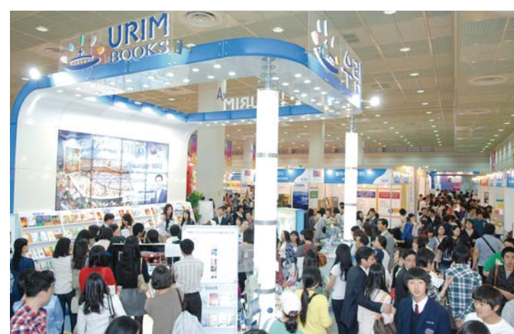
Urim Books à la Foire Internationale du Livre de Séoul au Centre de Convention et d'Exposition COEX

La 16ème Foire Internationale du livre de Séoul a démarré le 12 Mai et s'est clôturée le 15 Mai au Centre de Convention et d'Expositions, Samsong-dong, Séoul, en Corée avec pour thème, « Le livre lit le futur ». Cette foire du livre présentait