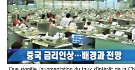
Que signifie l'augmentation du taux d'intérêt de la Chine