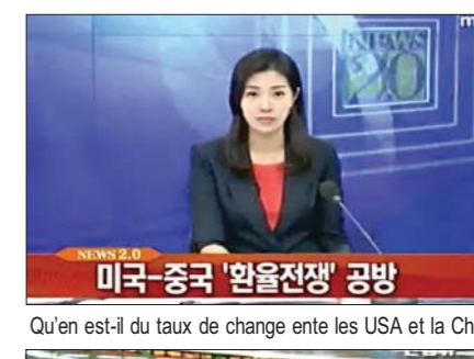
Qu'en est-il du taux de change entre les USA et la Chine