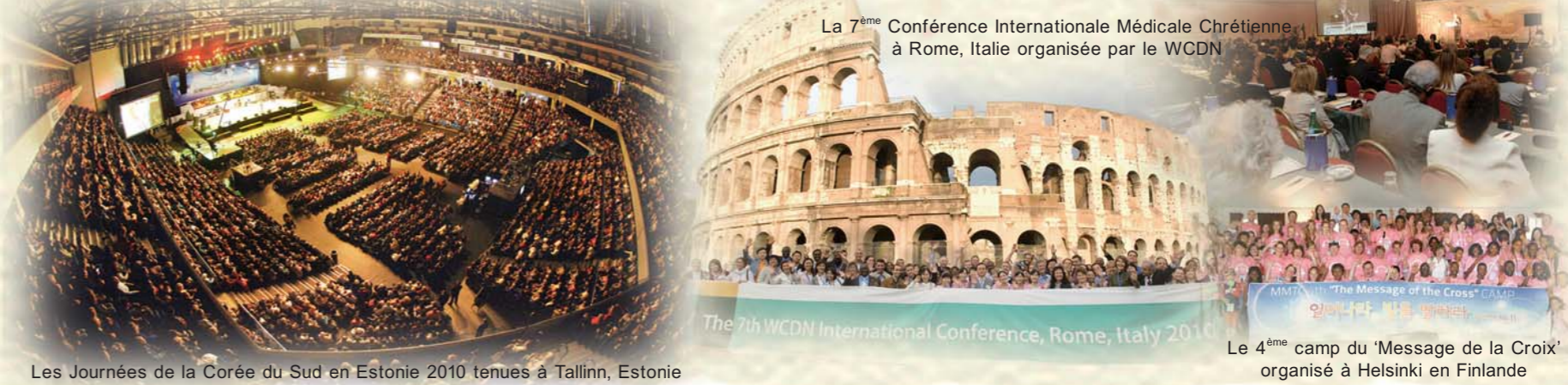
Les Journées de la Corée du Sud en Estonie 2010 tenues à Tallinn, Estonie

Lors de cette croisade d'Estonie ; des œuvres explosives du Saint Esprit ont été manifestées et d'innombrables personnes ont expérimenté et donné gloire à Dieu après avoir reçu la bénédiction et la guérison. Cette croisade a encouragé la communauté chrétienne rétrograde d'Europe et a enflammé les croyants en Christ par le Saint Esprit.