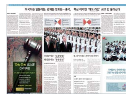
Le Joong-ang Daily, MBN, (Réseau Business Maeil) The Yonhap News, SBS (Système de Retransmission de Séoul)