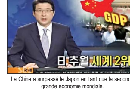
La Chine a surpassé le Japon en tant que la seconde grande économie mondiale.