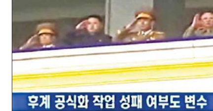
Le fils du leader de Corée du Nord se lève comme successeur probable.