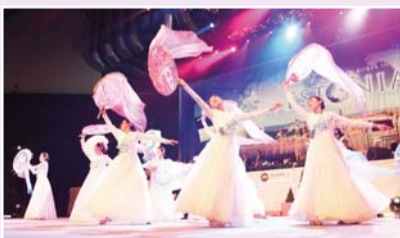
Festival de Guérisons Miraculeuses d'Estonie (2010)