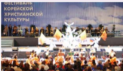
La Croisade Unifiée de Russie (2003)