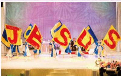
La Performance au 29ème Anniversaire de l'Eglise

Ils présentent la grâce de Dieu au travers de leurs louanges, danses, danses d'adoration, instruments et musique traditionnelle coréenne lors de réunions dans et hors de la Corée. Ils touchent aussi le cœur d'un grand nombre d'âmes au travers de GCN TV (Réseau Mondial Chrétien). Parmi ces groupes, il y a le Groupe de Danse d'Adoration de la Puissance. Avec une variété de leurs danses d'adoration qui donnent gloire à Dieu, elles ont aussi reçu l'amour des membres de l'église.