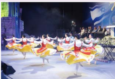
La Croisade Unifiée d'Israël (2009)