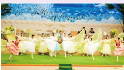
Performance Spéciale pendant la Veillée de Vendredi Soir