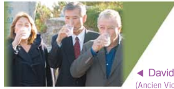
◀ David Waisman (Ancien Vice-Président du Pérou, à droite)