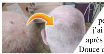
◀ «Je souffrais d'inflammation de la peau sur ma tête, mais j'ai été complètement guéri après l'avoir aspergée d'Eau Douce de Muan.» Frère Renner Cartier (Belgique)