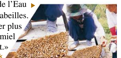
Ancien Yanghyun Park (Kyungsangnam-do, Corée)

◀ «J'ai fait boire de l'Eau Douce de Muan à mes abeilles. Plus tard j'ai pu récolter plus de deux fois plus de miel qu'auparavant.»