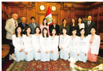
Le team missionnaire visite le bâtiment de l'Assemblée Nationale du Pérou