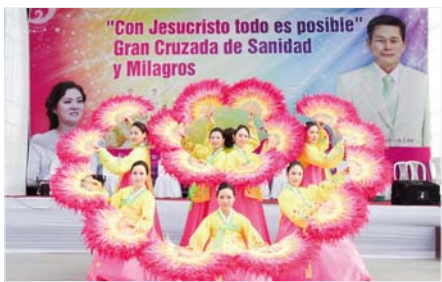
La performance du Team de Danse d'Adoration de Puissance a ajouté du Bonheur à la croisade de Puissance avec le Mouchoir à Carabaya