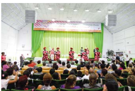
Culte du 6 ème anniversaire de l'Eglise Manmin du Pérou