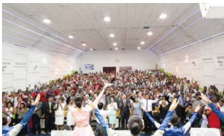
Le temps de louanges lors du Séminaire Pastoral tenu à l'Eglise Manmin du Pérou