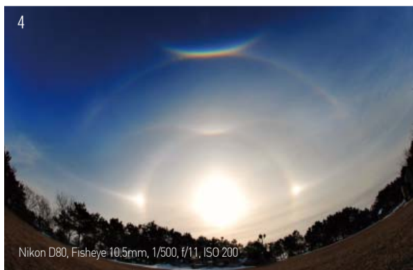
Nikon D80, Fisheye 10.5mm, 1/500, f/11, ISO 200