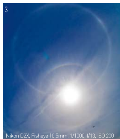
Nikon D2X, Fisheye 10.5mm, 1/1000, f/13, ISO 200

qu'ils ont expérimenté le premier arc-en-ciel circulaire au-dessus de l'Eglise Centrale le 15 Mai 1988