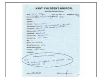
Plus de lymphome dans l'examen de la moelle osseuse