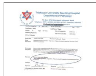
La biopsie des nodules lymphatiques a montré qu'il avait un lymphome au troisième degré

Je donne toute reconnaissance et gloire au Dieu vivant qui a béni les membres de ma famille pour recevoir des opportunités pour le salut au travers de la maladie de mon fils.