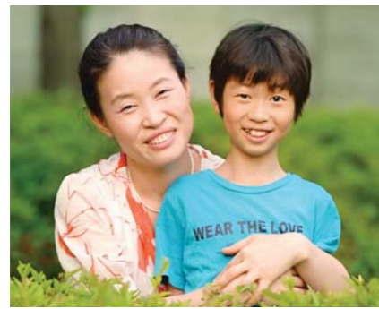
コ・ボンク執事(1-4女性宣教会)

私は中学生の時からメガネをかけていて、25年間、メガネをはずしたことがありませんでした。一度は息子がメガネを踏んで折ったことがありました。何日間かメガネなくて過ごしましたが、ひどいめまいと頭痛でまともに歩けません。地面が波打つように迫ってくるようでした。ジグザグに歩くくらいでした。乱視がひどかったからです。また、メガネがしょっちゅうずれ落ちて、肌アレルギーが起きるなど、困ったこと