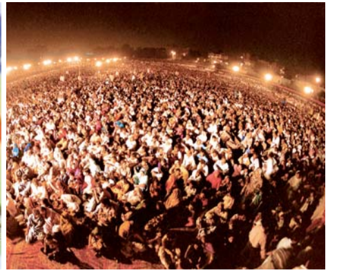
2000年パキスタン連合大聖会