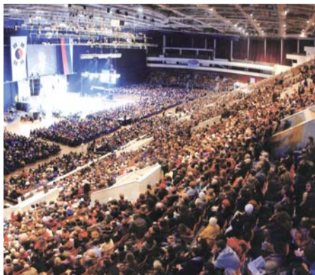
2003年ロシア連合大聖会