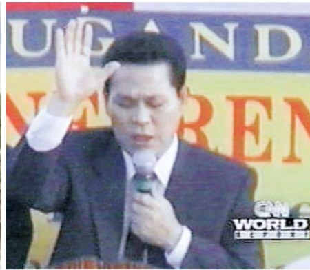
CNNで報道された2000年ウガンダ連合大聖会