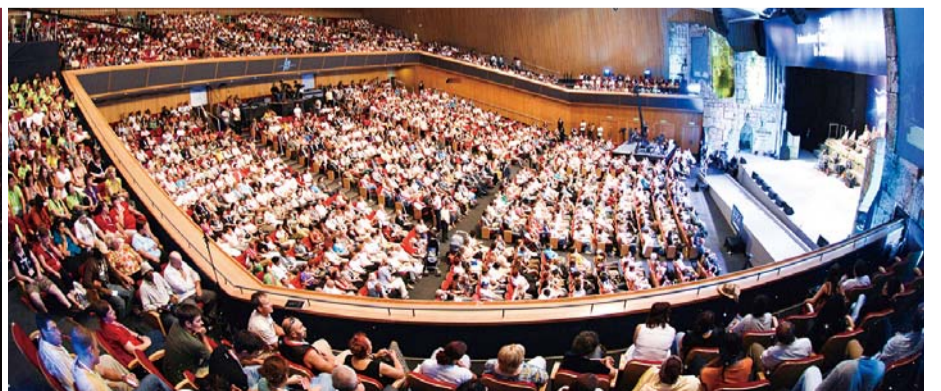
地の果てにイスラエルのエルサレムでイエス・キリストを宣べ伝えた2009年イスラエル連合大聖会