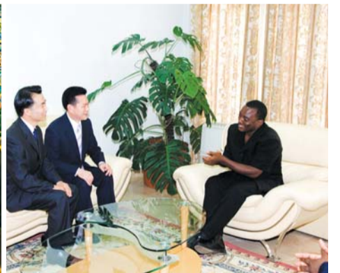
2006年コンゴ民主共和国のカビラ大統領との歓談