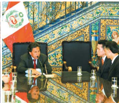
2004年ペルーのトレード大統領との歓談