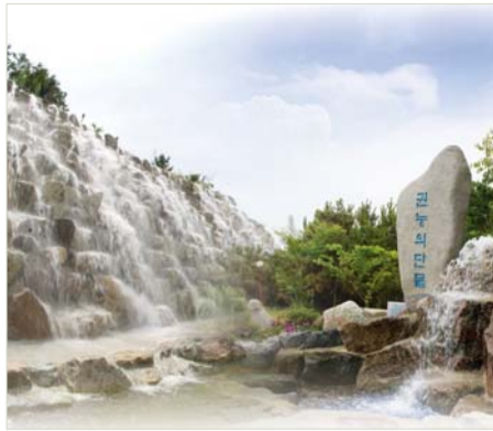
奇蹟の現場、ムアンの甘い水の泉

2009年 9月には「イスラエル連合大聖会」を開き、エルサレム国際コンベンションセンターで「イエスがなぜ私たちの救い主であるのか」を大胆に宣べ伝えた。この聖会はAFP、ロイターなど世界有数の放送局が取材報道し、33の放送局を通して220か国以上に放送された。これは全聖徒とともに結んだ、血のにじむような祈りの実だった。