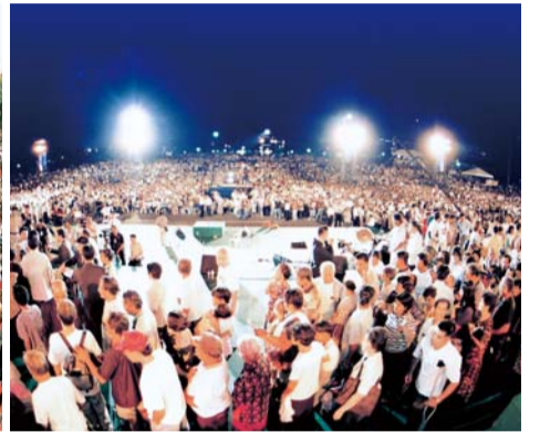
2001年フィリピン連合大聖会