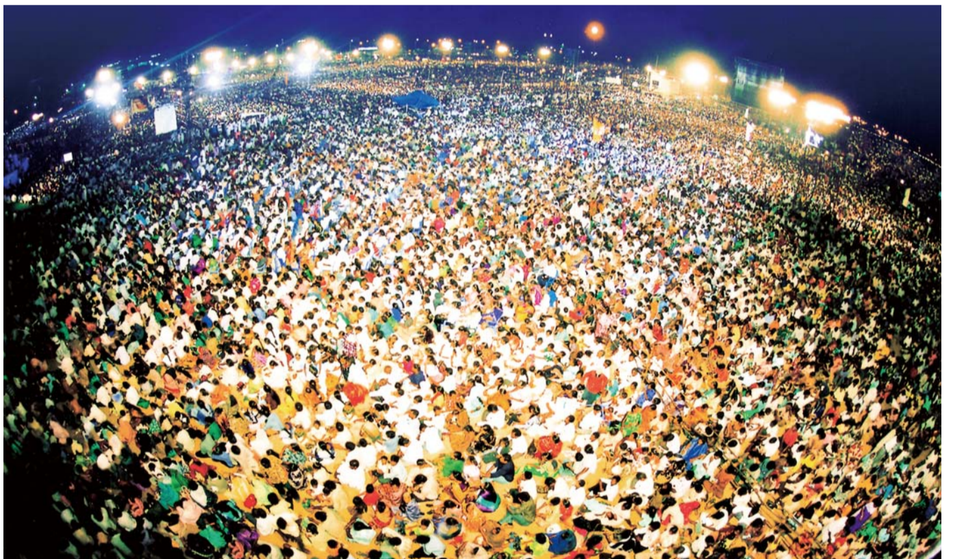
延べ300万人以上が殺到、数えきれないいやしと改宗のみわざが現れた2002年インド連合大聖会