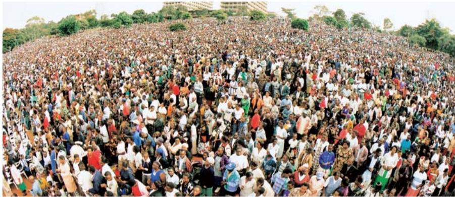
2001年ケニア連合大聖会