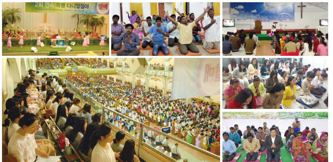
▲ 全世界の万民の聖徒はダニエル徹夜祈禱会を通して神の答えと祝福を引き下ろす体験的信仰を持ち、天国への希望に満ちた信仰生活をしている(写真は2015年後半期「2回連続特別ダニエル徹夜祈禱会」本聖殿とインド、ネパール、タイの聖徒たち)。

4月10日(日)には授賞式がある。毎日午後8時40分からの芸能委員会のプレ賛美で始まり、9時から11時40分まで(土、主日は11時まで、金曜日は金曜徹夜礼拝)、本聖殿と第2,3聖殿などで行われている。ホームページ(www.manmin.org)でも祈りに参加できる。