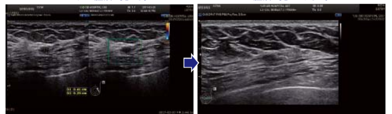
▲ 祈りを受ける前:左乳房の3時方向に0.41cm大の腫瘍が見える。