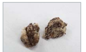
祈りを受けた後に耳の中から出てきた異物

60年もの耳の問題を一気に解決してくださった慈しみ深い父なる神様、愛なる主にすべての感謝と栄光をおささげします。ハレルヤ！