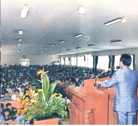
1989 안양성결신학교 추계부흥회