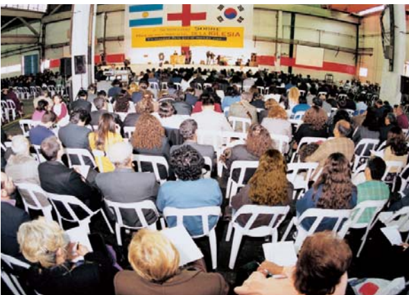
1997 제2회 아르헨티나 목회자 세미나 및 부흥성회