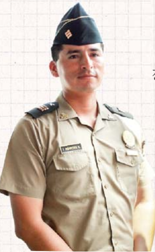
이후에 그 방송이 엔라세임을 알게 됐지요.

저는 기독교 가정에서 성장했지만 사회생활을 하면서 하나님으로부터 점점 멀어졌습니다.