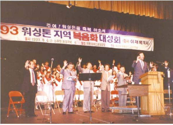
1993 워싱턴 지역 복음화 대성회