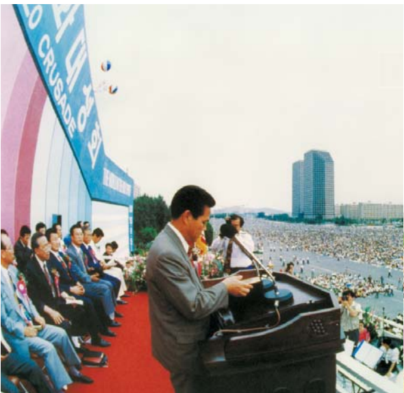
1992 세계 성령화 대성회 (여의도 광장)