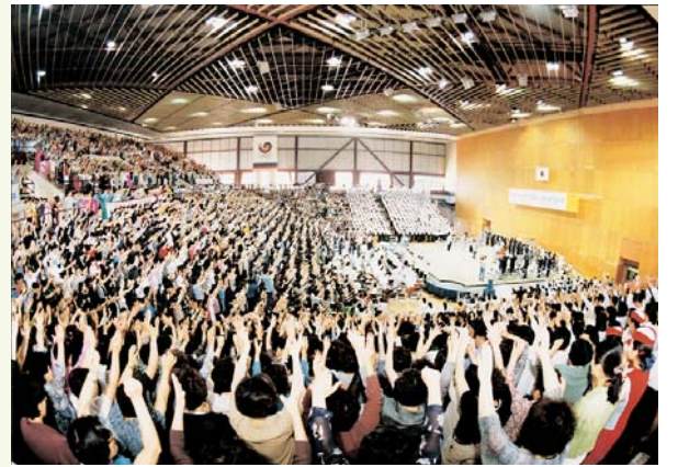
1998 자녀 안심하고 학교보내기 운동 전국 기독교 대회