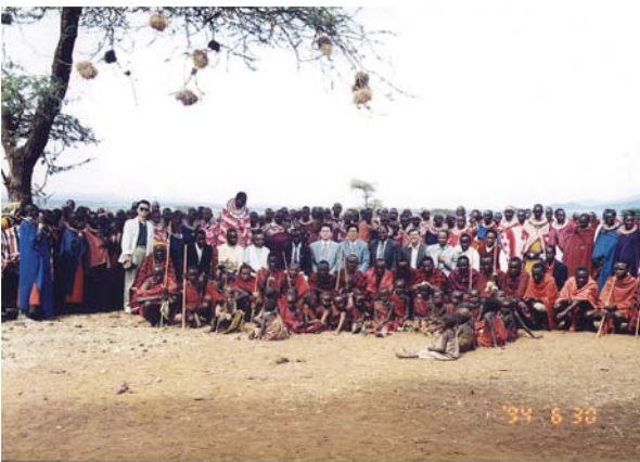
1994 아프리카 마사이족 원주민 선교