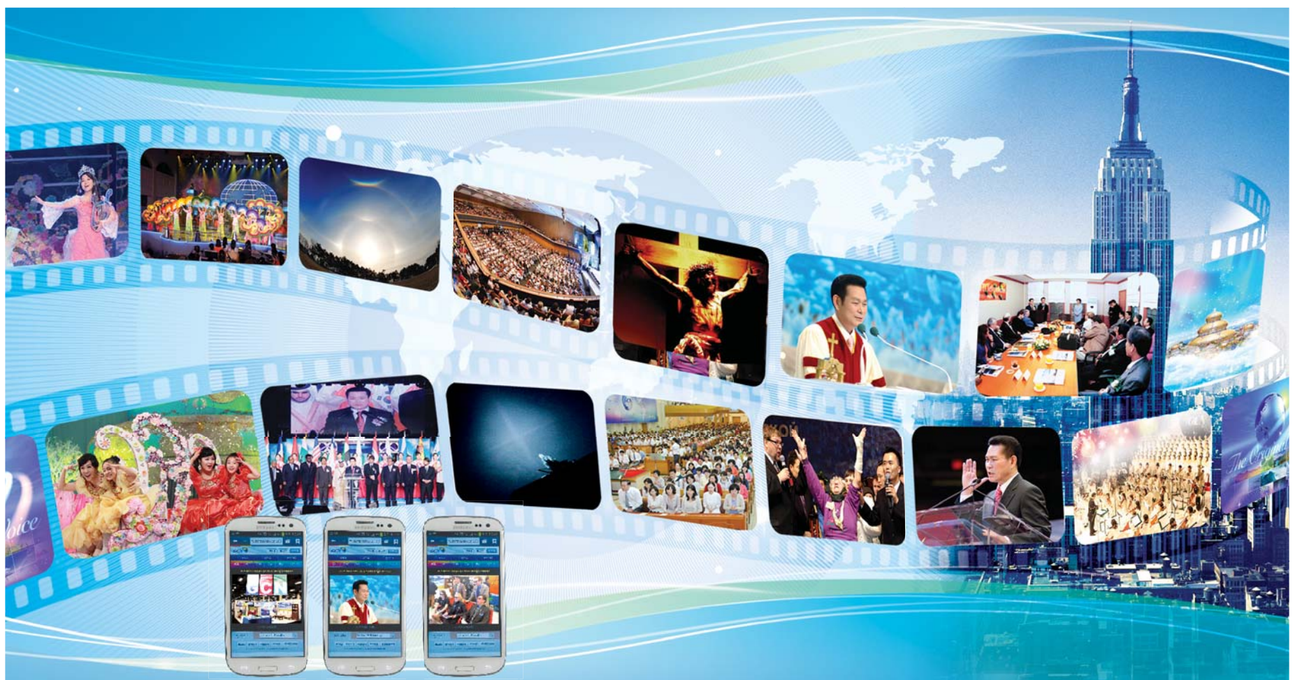
오직 영혼 구원을 향한 열정으로 문을 연 방송선교, 하나님께서 친히 인도해 주심으로 전 세계 곳곳에서 많은 구원과 축복의 열매가 맺혀 하나님께 영광 돌리고 있다. GCN 방송은 170여 개국에서 시청 가능하며, 스마트폰을 통해 다양한 프로그램과 우리 교회 각종 예배와 다니엘철야 기도회에 실시간으로 함께할 수 있는 '24시간 모바일 웹서비스(m.gcntv.org)'를 제공하고 있다.

2005년 9월 1일, 미국 엠파이어스테이트 빌딩 송출실에서 첫 전파를 쏘아올린 GCN(Global Christian Network) 방송. 선교방송의 시작을 기뻐하신 하나님께서 이날 보여주시는 밤하늘을 수놓은 흰 광채의 십자가는 아직도 만민 성도들의 뇌리에 선명히 기억되고 있다.