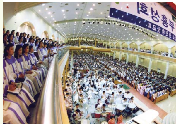
1999 제7회 이재록 목사 2주연속 특별 부흥성회 (5성전)