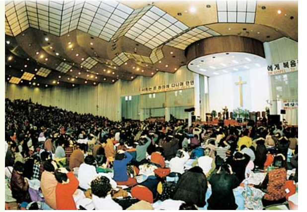
1998 비상 구국 성령충만대성회

1998년 부터 시작된 교회적인 시험에 성도들은 더욱 기도에 힘쓰며 오직 선을 좇아 승리했다. 이후에 펼쳐진 하나님의 상상할 수 없는 축복을 통해 모든 것이 축복의 연단임이 증명됐다.