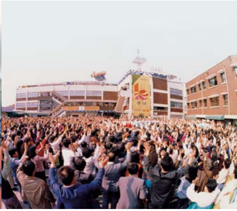
1992 교회 창립 10주년 기념 야외행사 (4성전)