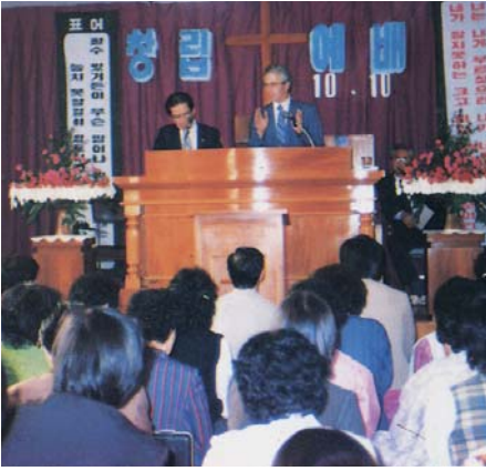
1982 교회 창립예배 (1성전)