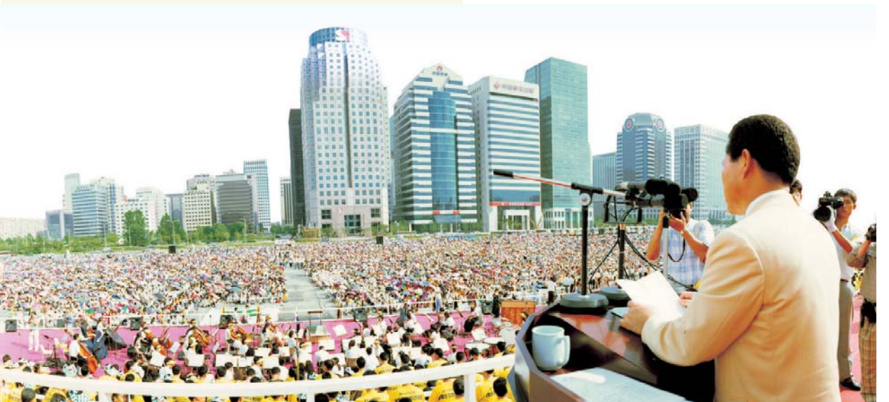
1995 광복 50주년 기념 평화통일 희년대회 (여의도 광장)